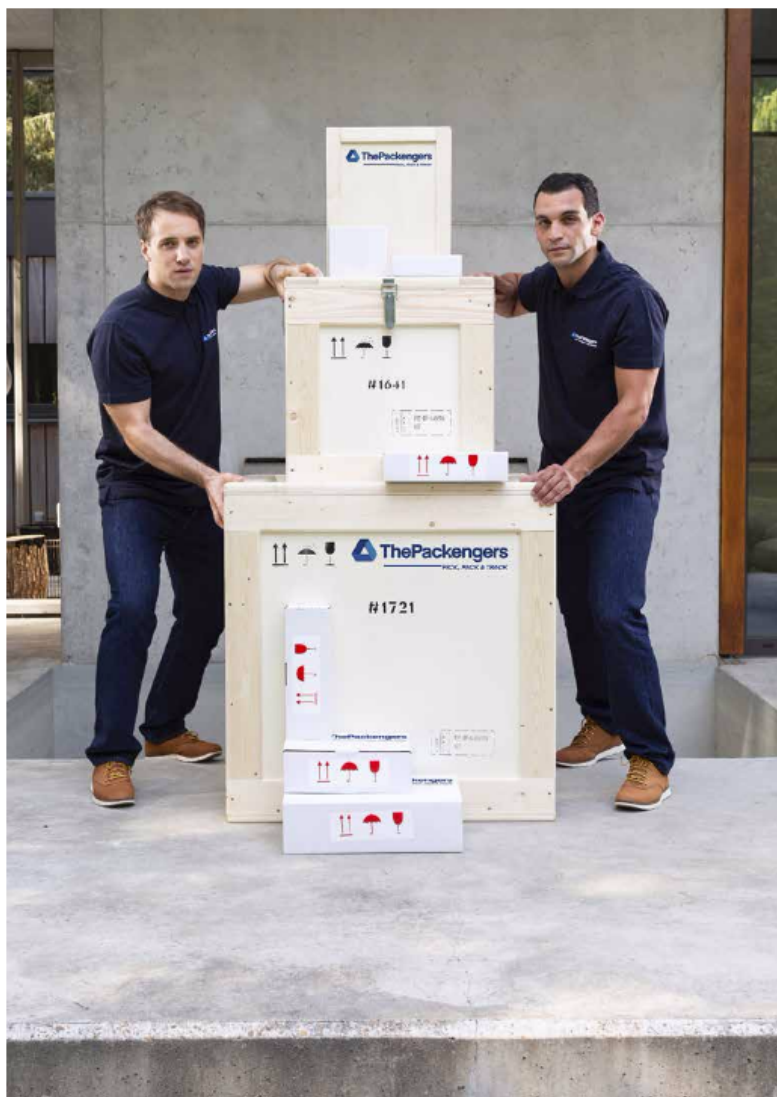
Des employés d'ESI convoyant des œuvres d'art.