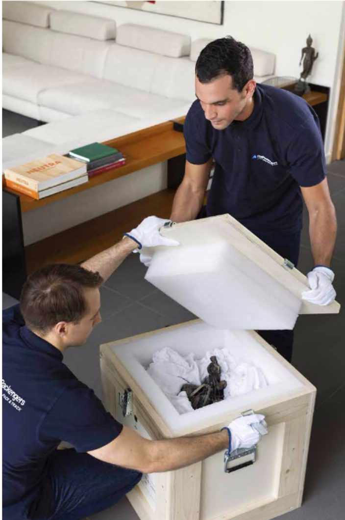
Les services d'ESI débutent avec l'emballage.